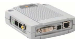
Axis網路產品的簡易監視方案